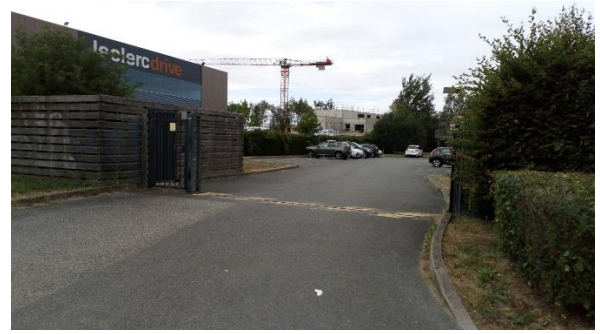
Entrée du 2 rue Georges Meliès