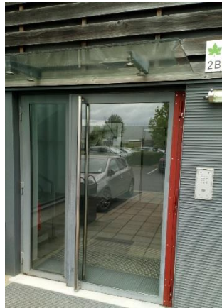
Entrée 2 B